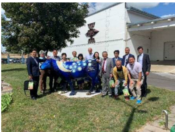
<ピエノ・ジュバイズデスにて>

10時からは、リトアニアの主要な産業のひとつである乳製品工場を訪問。ヨーロッパでもっとも売れている牛乳を作っている企業である、ピエノ・ジュバイズデスでは、工場内の視察や、アイス、フレーバー牛乳、カッテージチーズなど様々な製品を試食させていただき、その種類の豊富さと味わい深さに驚嘆した。