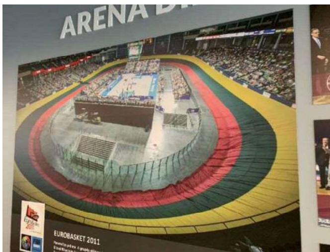
<ユーロバスケット開催時の写真>

アリーナの中に250mの競輪場があり、その中心でバスケットボールなどのスポーツができます。パネヴェジス市にはリトアニアで1番の自転車競技選手がおり、バスケットボール2017第2位のチームもあるなどスポーツが盛んなところです。