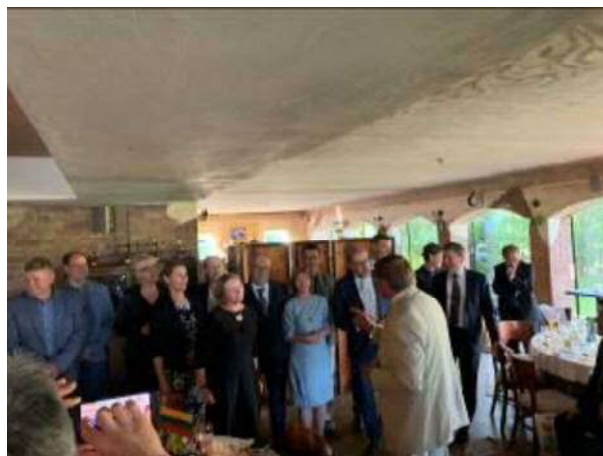
＜パネヴェジス市の皆さんの合唱＞

市内を視察しながら、教育施設の中学校を訪問する。もうすでに夏休みに入っており生徒はおらず、校長先生他10名ほどの先生が対応してくれる。生徒732人に対して先生は70名。女性教師が多いそうで、若い先生は英語も話せるようだった。1学級は30人程らしく、生徒の個々に応じたカリキュラムを組み、その先の進路についても相談に乗っているようであった。特に素晴らしいと感じたのは図書室のあり様で、