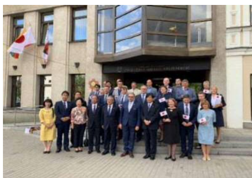
<パネヴェジス市役所前にて>

豊橋市はリトアニアのホストタウンです。今回、豊橋市とリトアニア・パネヴェジス市と、パートナーシティ協定を締結する目的で、友好訪問団の一員として、議会から参加させていただきました。6月26日～7月2日の日程で、リトアニアの産業、スポーツ、文化、歴史にふれ、貴重な経験を得ることが出来ました。