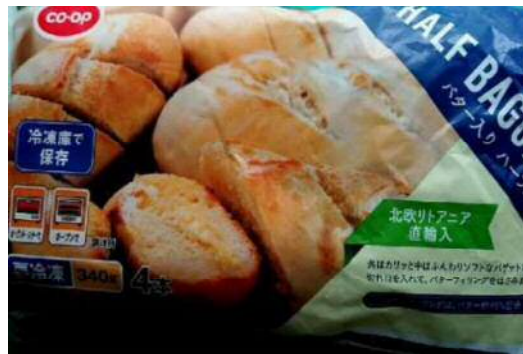
＜リトアニアの冷凍パン＞

まずはリトアニアという国を知ってもらうための取り組みが必要であると感じた。後日、知人から意外にも、生協にて冷凍パンが販売されていて、大変好評であることを教えてもらった。（写真参照）このよう