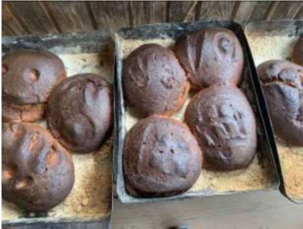
＜焼きあがったライ麦パン＞

土曜日で官庁関係は訪問できず、文化施設を視察する。昔の建物や生活状態を再現している民族誌馬博物館では、この地方の特産であるライ麦を使ったパン作りを体験する。ライ麦パンは神からの贈り物として生活と信仰に根付いていることを教わった。この国の生活