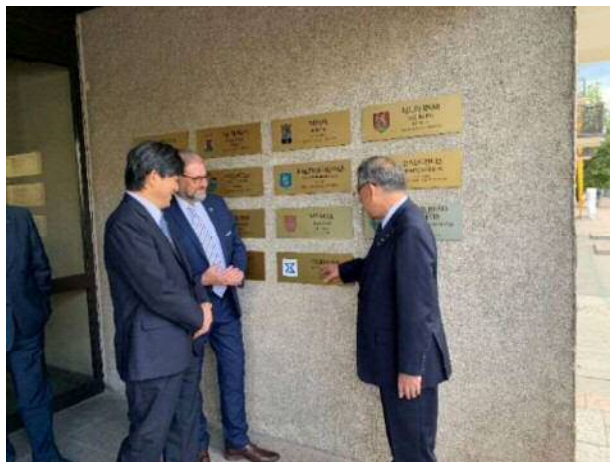
<豊橋市の銘板の前にて>

今回、パートナーシティ協定締結先のパネヴェジス市リタス・ミコラス・ラクカウスカス市長を山崎リトアニア特命全権大使と共に表敬訪問、パートナーシティ協定を記念した銘板お披露目式後、ロマンティックホテルに場所を移して市民訪問団と合流し協定締