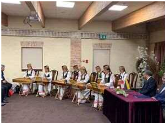
<協定締結式 カンクレスの演奏>

その後は、パートナーシティとなる豊橋市の銘板の披露式、協定締結式を行った。協定締結式では、伝統楽器であるカンクレス（小さな琴）による美しい演奏