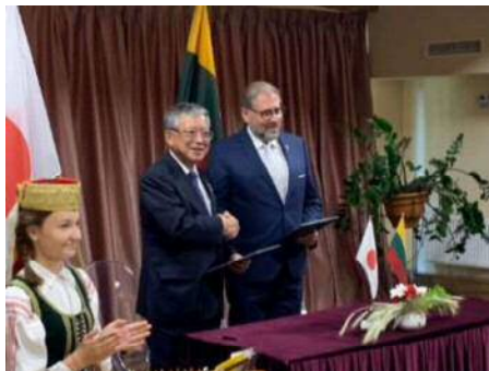
< 締結式の様子 >