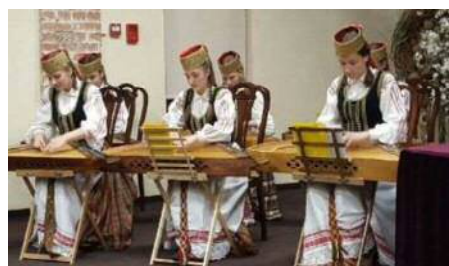
<カンクレスの演奏>