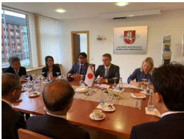
<農業省副大臣表敬>

日本とリトアニアが、農業のパートナーとして交流を深めていきたいとの強い意志を伺いました。副大臣は「市と市の交流は重要である。個のレベルの交流も重要だと信じている。日本とリトアニアは、食文化が同じである。今後、技術交流を 図れないか」との考えも示していただき、将来ビジョンも含め熱く語っていただきました。