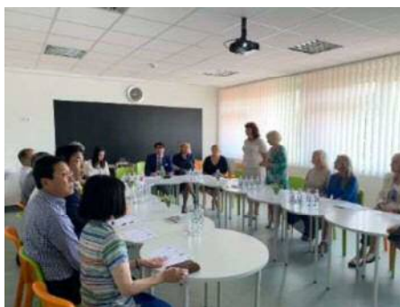
< 中学校での説明の様子 >

パネヴェジス市では3日間滞在し、中学校（夏休みに入っていて生徒は不在）、農業施設である乳製品工場、スポーツ施設（C I D O A R E N A）、文化施設（民族誌馬博物館）等視察し、リトアニアの人たちの歴史や文化、経済状況などたくさんのことを学ぶことが出来ました。