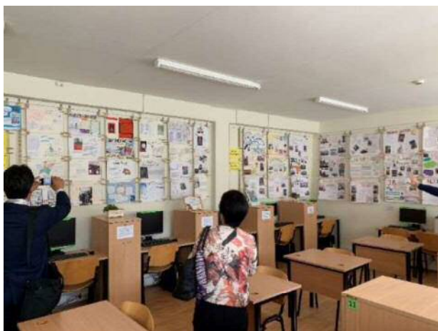
<中学校の教室の様子>

翌日は、日本から子供たちが伺う予定にしている、ビュトゥリオ中学校を視察しました。