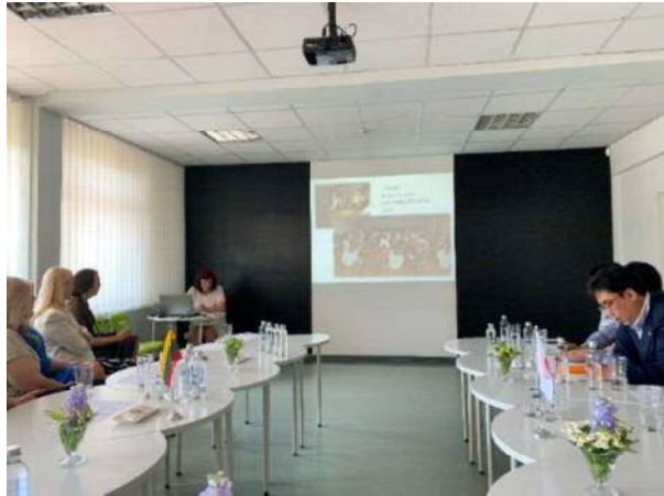
＜中学校での先生方によるプレゼン＞

リトアニアの中でも優良校として教育科学省に認められている学校を訪問しました。学校では、新たな将来をつくるためのビジョン10項目を掲げ、個人のレベルにあった質の高い教育をされていることに感銘を受けました。そのため、教師もベテランを集めていると