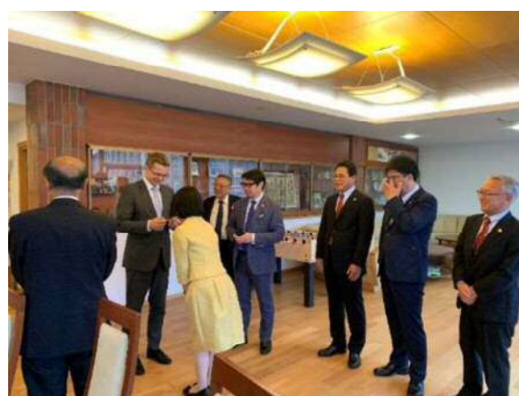
<農業省副大臣表敬>

リトアニアは畜産、酪農、オーガニック、はちみつ加工など様々な農業が盛んであるとのこと。日本はリトアニアにとって重要なパートナーであり、お互いの連携によるメリットなどについて、1時間を超えるほど熱心に話し合った。