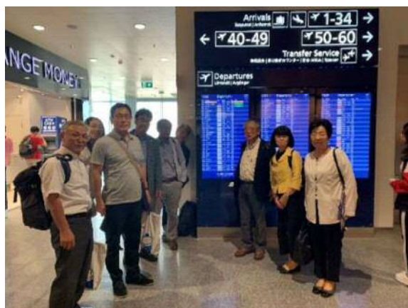
<ヘルシンキ空港にて>