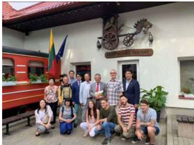
<人形劇場の若きパペッティアと共に>

ボールチームのオーナー企業でもある乳製品工場。リトアニアに4工場を有し、国内では大企業といえる。工場内を見たところロボットを活用して製品化しているわけではなく、箱詰めは人の力を必要としている。ここの会議室で、今年3月「ええじゃないかとよはし映画祭」に出品されたいろいろな乳製品を試食させてもらうが、結構美味しく豊橋でも売れるのではないかと思った。次の視察先、C I D Oアリーナは自転車競技が出来る250mバンクを常設する珍しいアリーナで、センターコートはプロバスケットボールなどの競技が行われる素晴らしいアリーナである。私たちが訪問しているときも10人程の人が自転車競技の練習をしていた。年間320日使用しているらしく、年間スポンサー企業には特別観覧席が用意されている。昼食後、文化施設のガラス工房と人形劇場を視察し、様々な文化が地域に根差し、発展していることを感じる事が出来た。