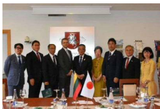
< 農業省副大臣表敬 >

農業省を表敬し、農業副大臣との意見交換の機会をいただいたが、リトアニアは日本と食文化が似ており、日本人にとって味覚が近く、受け入れやすいのではないかということだったが、このことは滞在時の食事からも感じ取ることができた。ジャガイモや豚肉、乳製品はリトアニアの主要食材といわれ、大麦やライ麦なども有名だが、輸出について安くクオリティの高い加工牛肉の輸出を検討しており、最近では冷凍パンを東京ディズニーランドでも扱ってもらっているとのことだった。