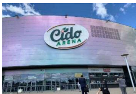
< C I D O A R E N A >

視察に同行してくださったパネヴェジス市の職員さんや、市議会議員さんとの交流も、貴重な経験になりました。その中で市外への若者人口