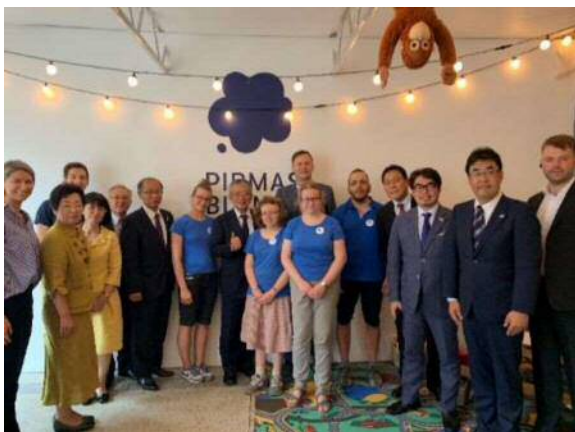
<パラリンピック会長表敬>

次に、ヴィリニユス市内の障がい者雇用によるカフェへ向かい、そこでパラリンピック会長の表敬を行った。ここのカフェはパンケーキが大変おいしいということで、パンケーキをいただいた。すべてのパンケーキが一口サイズに揃えられており、甘さも控えめで日本人の口にも合うと感じた。